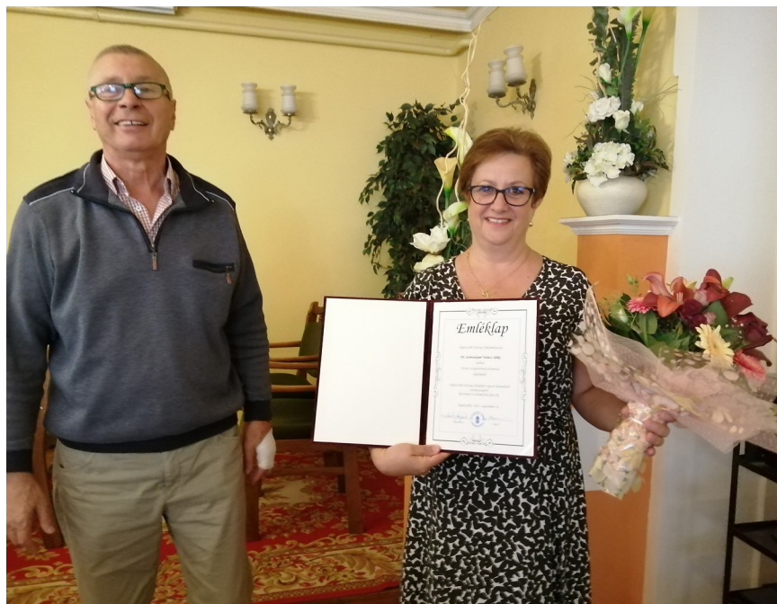
Védőnői pálya - 30 éves jubileuma