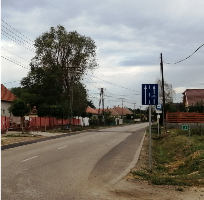
Az új kerékpársáv

Az utak rendbetétele folyamatban van, a Fő út páros oldalánál kell a padkát kijavítani, hogy ne álljon meg a víz, mert jön a tél és sok kár keletkezhet a burkolatban. Közben igyekszünk rendbe tenni a földutakat, és az utak mentét gépeinkkel. Gépállományunk ismét egy kistraktorral, pótkocsival, és hótolóval gyarapodott, a Magyar Falu Programnak köszönhetően. Elkészült a parkoló a Temetőnél és újabb járdák épültek a református és a katolikus oldalon egyaránt, valamint elszállításra kerültek az évek óta elbontott, elhagyott sírkőmaradványok.