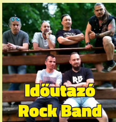
Időutazó Rock Band