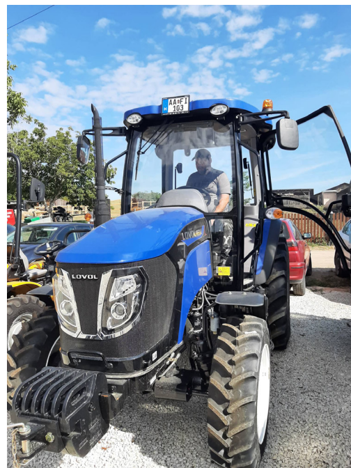
Az új traktorunk